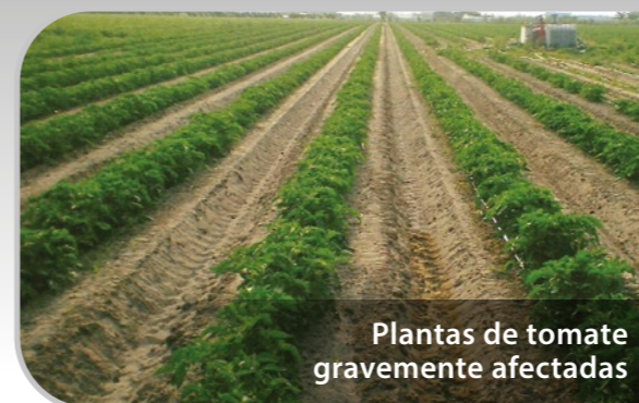
Plantas de tomate gravemente afectadas