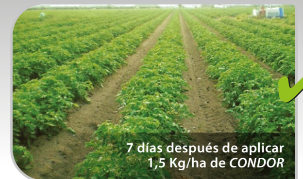
7 días después de aplicar 1,5 Kg/ha de CONDOR